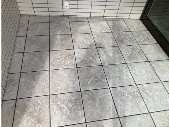
3.エントランスホール (タイル・ガラス)